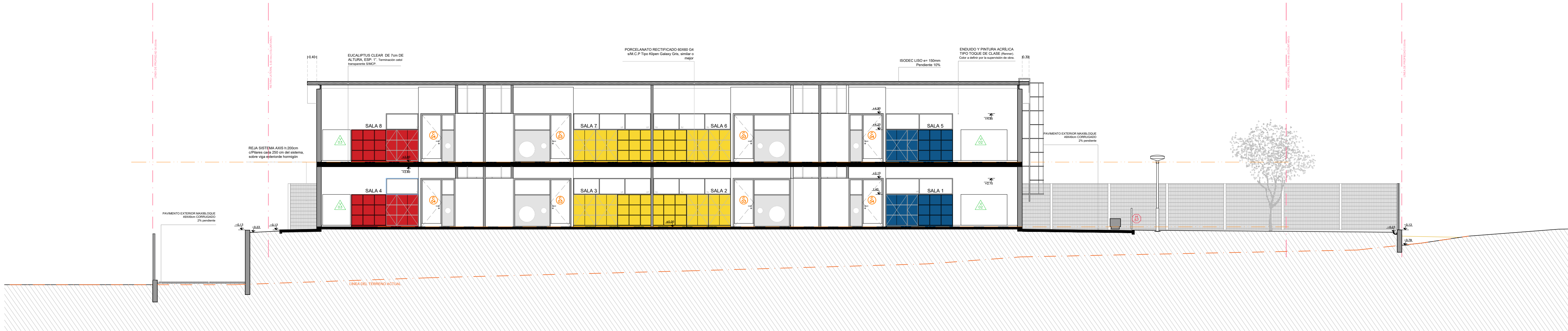
CORTE EE ESC: 1:100