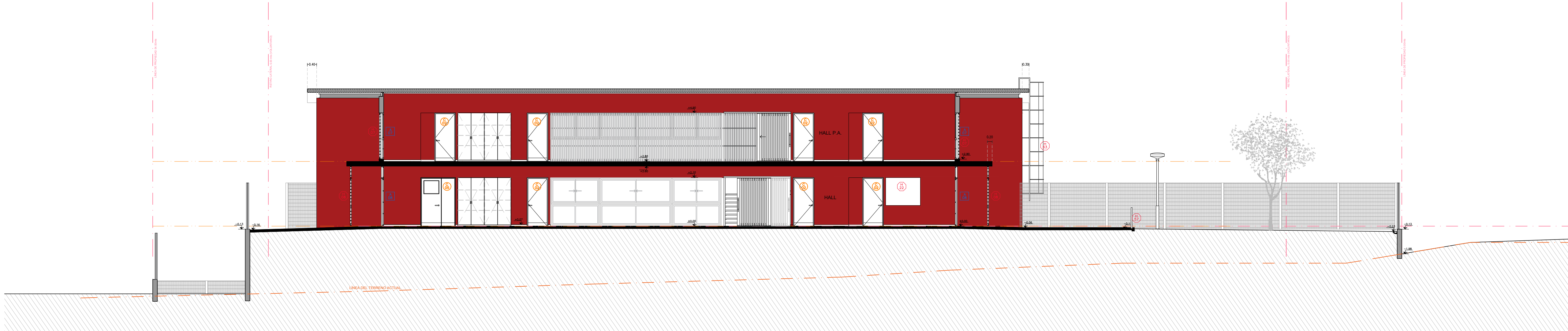
CORTE GG ESC: 1:100